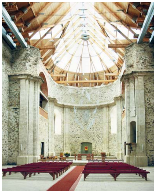
Zachráněný kostel v Neratově může být příkladem dobré praxe: rekonstrukce přiznává historii stavby, nový život poutního místa okouzluje a přitahuje.

„Některé diecéze se nicméně ptají, jak (v tomto bodě) nalézat pastorační odpovědi, které by vhodněji reagovaly na nově se objevující po-