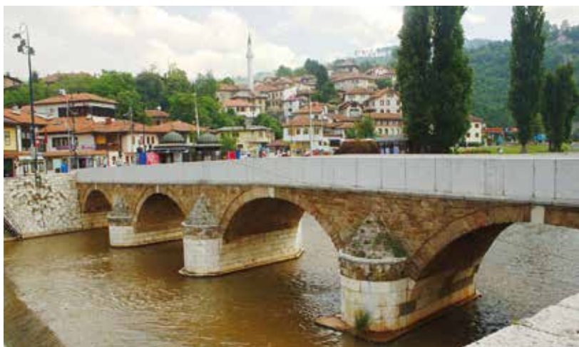
Na tomto mostě přes řeku Miljacku lze nádherně přemýšlet o rybách.