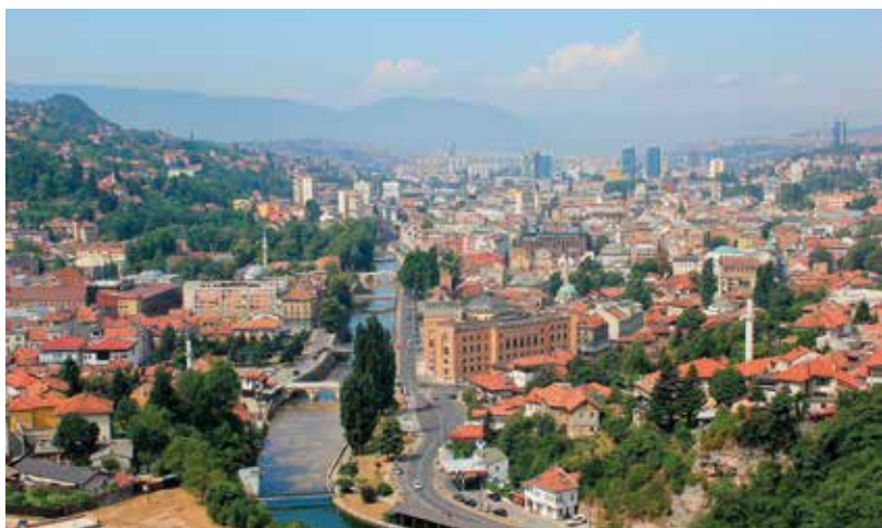
Sarajevo na fotografii Juliana Nyči.

NĚKDO POVAŽUJE ZA NEJTĚŽŠÍ TURNAJ stolních tenistů mistrovství světa, jiný by tento primát přisoudil spíše mistrovství Asie s ohledem na početnější zastoupení skvělých čínských hráček a hráčů. V obou nepochybně velice náročných šampionátech je pro celkové vítězství v singlu zapotřebí vyhrát přibližně sedm utkání (z toho čtyři či pět proti opravdu špičkovým soupeřům), přičemž jednotlivé zápasy bývají obvykle rozloženy do pěti hracích dnů. Ovšem existoval – a v upravené podobě existuje dodnes – turnaj, ve kterém každý musel odehrát během víkendu devět zápasů (plus dvě utkání navíc v páteční večer), a to proti nejlepším hráčům Evropy. Jmenuje se Top Twelve, koná se pravidelně každý rok v jiné zemi, přičemž pozván je pouze tucet nejvýše postavených hráček a hráčů aktuálního