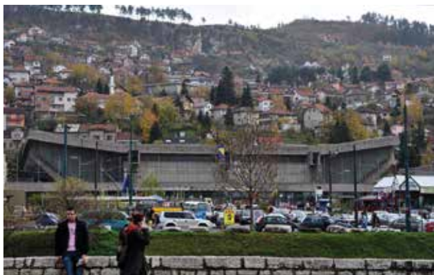
Také vám sportovní hala Skenderija trochu připomíná obrněné vozidlo z Hvězdných válek?

Zatím naposledy upíral civilizovaný svět oči k těmto místům v letech 1992–1995, během nichž válka mezi nástupnickými státy bývalé Socialistické federativní republiky Jugoslávie proměnila nádherné olympijské město na březích řeky Miljacky, rodiště mnoha světově proslulých osobností včetně filmového režiséra Emira Kusturici či hudebního skladatele Gorana Bregoviče, v rozbombardované ruiny. Sarajevské předměstí Grbavica, kde byly při olympiádě ubytovány některé sportovní delegace, nesmyslné válečné běsnění srovnalo se zemí. Proto se raději vraťme do poklidného pohostinného Sarajeva roku 1977. Právě tam se máš na základě pozvání od ETTU zúčastnit prestižního turnaje Top Twelve, neboť ti aktuálně patří pátá příčka evropského žebříčku. Nejsi zde poprvé. Vždyť před čtyřmi lety se ve zdejší sportovní hale Skenderija konalo Mistrovství světa. Rovněž nyní se turnaj uskuteční v této obrovité hale, ovšem místo šestnácti tentokrát postačí pouze šest stolů Joola, na kterých se bude pravidelně střídát turnaj mužů s turnajem žen. Není to však jediný rozdíl oproti tvé předchozí návštěvě bosenské metropole. Sluncem prozářený duben nyní nahradil mrazivý únor a někdejší ubytování