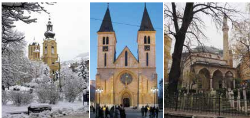
Hlavní pravoslavný chrám, Chrám Ježíšova srdce a Farhadova mešita.

Sarajevu se říkalo evropský Jeruzalém, neboť zde ve vzájemném smíru žili po staletí pravoslavní křesťané, katolíci, muslimové i židé. Při procházce zde narazíš na mešity, katedrálu zasvěcenou narození Panny Marie či chrám Ježíšova srdce, nechybí několik synagog. Pozornost celého civilizovaného světa si Sarajevo ve své novodobé historii vysloužilo přinejmenším třikrát. Roku 1914, kdy zde student Gavrilo Princip spáchal atentát na následníka rakousko-uherského císařského trůnu Františka Ferdinanda d'Este. Dále v roce 1984, kdy Sarajevo přivítalo účastníky XIV. zimních olympijských her, včetně britských krasobruslařů Torvillové s Deanem, kteří v soutěži