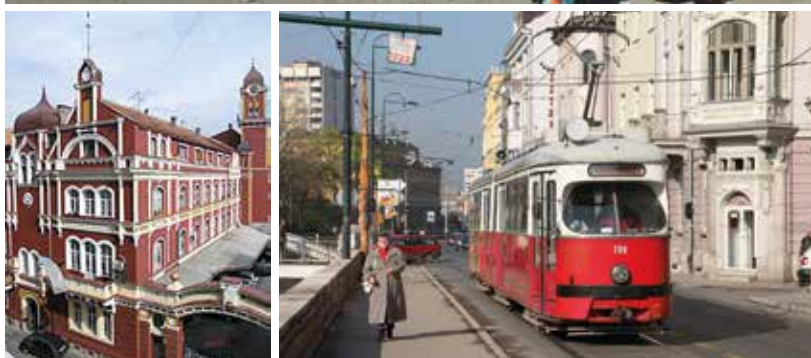
Největší sarajevská trznice na dobové pohlednici z třicátých let, místní pivovar na snímku Matěje Baňhy a tramvaj jedoucí k tržnici.

v přízemním tříhvězdičkovém hotýlku je dnes vystřídáno společným ubytováním všech účastníků za peníze ETTU v jednom z nejluxusnějších sarajevských hotelů.